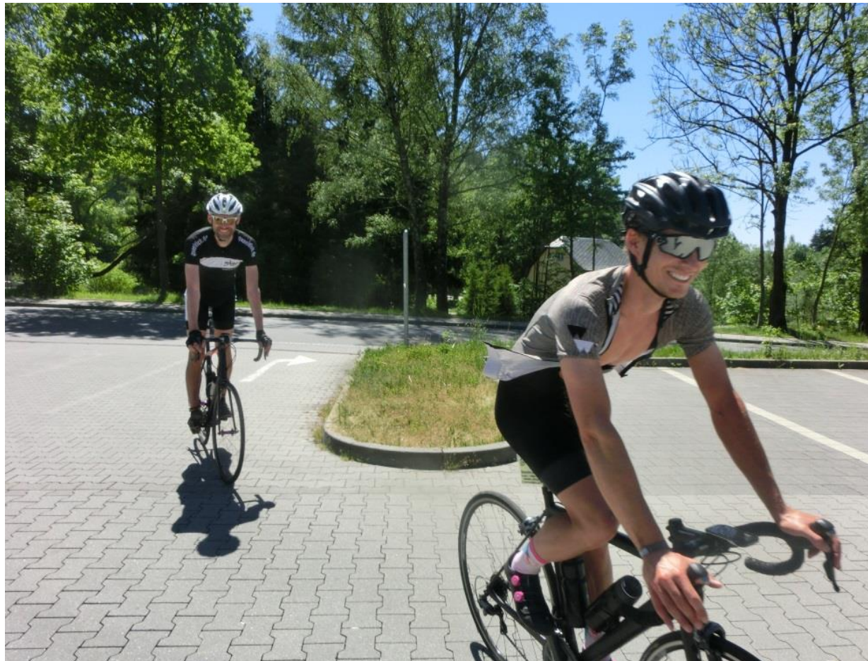
Vorfreude auf 2018, weil es am 28.5.2017 schön war

Beide wünschen wir uns eine regen- und unfallfreie Erlebnistour mit Zukunft im Friedensfahrtmonat Mai.