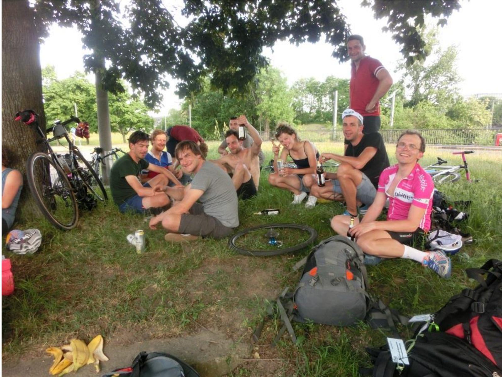
Abschied am Dresdner Hbf., 28. Mai 2017